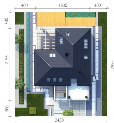
HomeKONCEPT-28 wersja podstawowa zagospodarowanie terenu