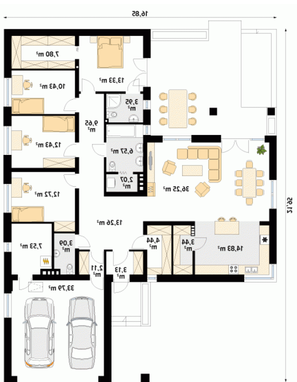
Parter 200.82 m 2