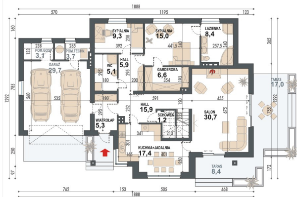
PARTER POWIERZCHNIA UŻYTKOWA 120,8m 2