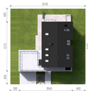
HomeKONCEPT HomeKONCEPT-02 G2 EN wersja podstawowa zagospodarowanie terenu