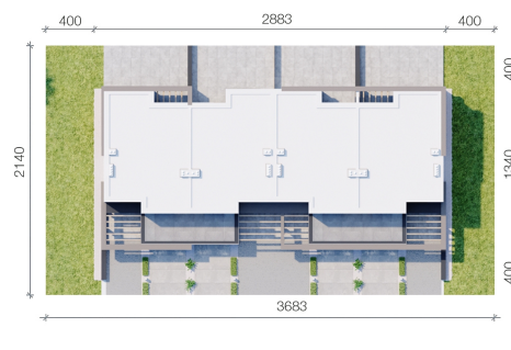
HomeKONCEPT PRZEKRYTOKI I SYTUACJE HomeKONCEPT-52 B2 zagospodarowanie terenu