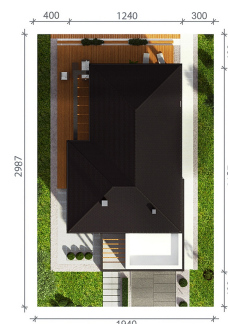
HomeKONCEPT PROJEKTY DOMÓW NOWOCZESNYCH HomeKONCEPT-46 wersja podstawowa zagospodarowanie terenu