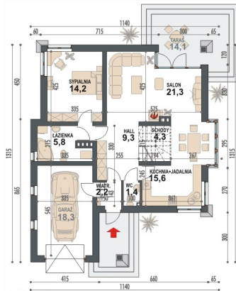
PARTER POWIERZCHNIA UŻYTKOWA 74,1m 2